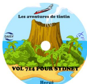
Vol 714 pour Sydney