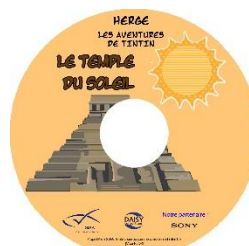
Le Temple du Soleil