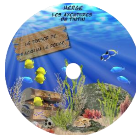
Le Trésor de Rackam Le rouge