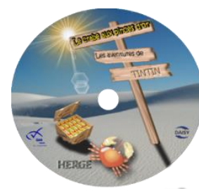
Le crabe aux pinces d'or