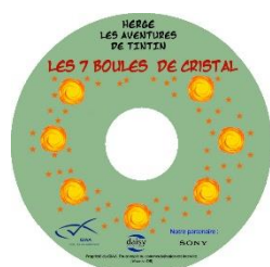
Les Sept boules de cristal