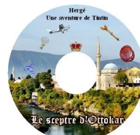
Le sceptre d'Ottokar