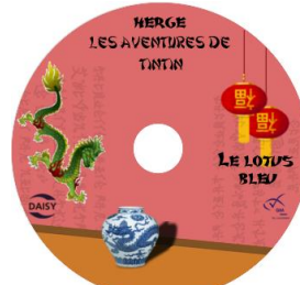
Le Lotus bleu