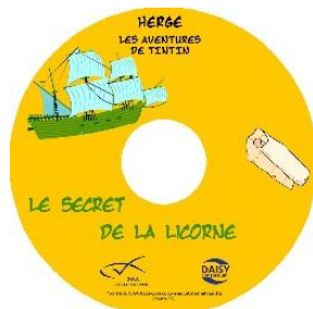
Le Secret de la Licorne