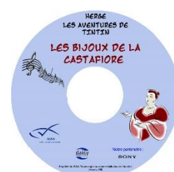
Les Bijoux de la Castafiore